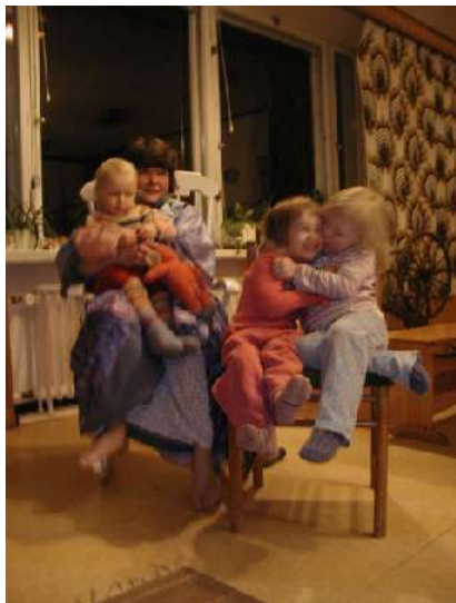
Esiäiti ja lapsukaiset